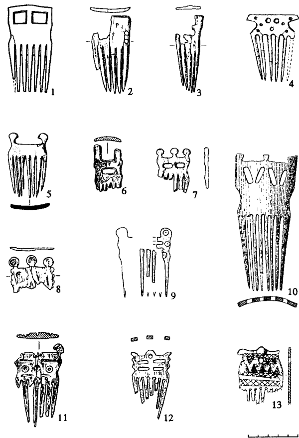
Рис. 1. Гребни из карасукских погребений (1 – Байкалова-II, м. 1; 2 – Кюргенер-I, к. 15; 3 – Мохов-I, об. 6; 4 – Черновая-VII, к. 2, м. 1; 5 – Варча-I, к. 8, м. 2; 6 – Малые Копены-III, к. 40, м. 1; 7 – Белый Яр-V, о. 68; 8 – Кюргенер-I, к. 6; 9 – Новый Белоаярск, к. 24; 10 – Сухое Озеро-II, к. 60; 11 – Малые Копены-III, к. 14, м. 3; 12 – Медведка, к. 17; 13 – Июсский, к. 7, м. 2). 2, 7, 13 – рог, остальное – кость

К большому и емкому по своему смыслу понятию гребней на сегодняшний день авторы раскопок относят 18 изделий, происходящих из погребений, и две находки из материалов поселения Торгажак, относящихся к карасукской культуре (рис. 1 и 2). Они могут быть разделены на две принципиально различающиеся по своим свойствам группы. Критерий отличия – назначение. Изделия первой группы относятся к разряду украшений (рис. 1). Предметы, объединенные во вторую группу, заметно отличаются по своим внешним признакам и техническим характеристикам, что позволяет считать их скорее орудиями труда, которые на основе этнографических параллелей могут быть названы чесалами (рис. 2). Учитывая принципиальную разницу в назначении и, как следствие, в использовании, рассматривать их необходимо по отдельности.