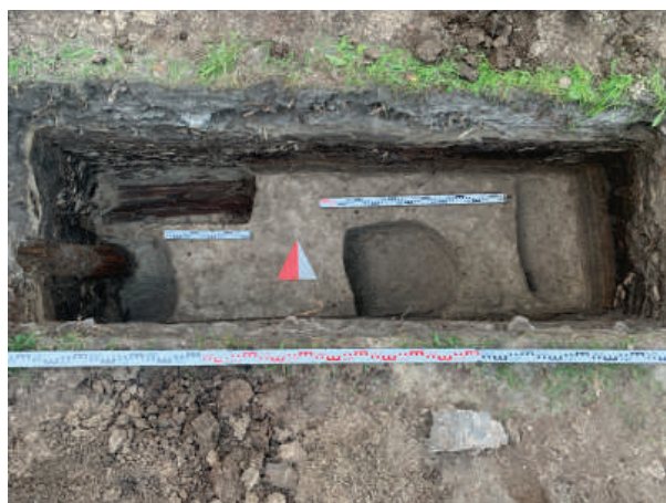
Рис. 17. Шурф 7. План фиксации по матерiku с частью крышки гробовины погребения 10