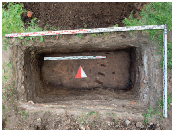
Рис. 21. Шурф 8. План фиксации по материке со следами работы экскаваторного ковша