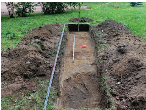
Рис. 22. Шурф 10. Фиксация по верху дорожного покрытия бывшей Мариинской улицы. Вид с запада