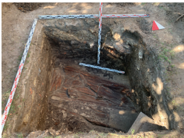
Рис. 12. Шурф 1. Фиксация по уровню выявления погребений 1–5. Вид с юга