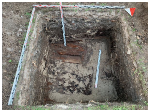
Рис. 13. Шурф 2. Фиксация по уровню выявления погребений 6–9. Вид с севера