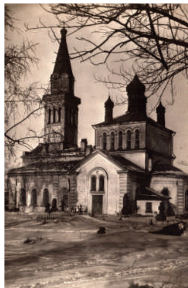
Рис. 9. Вид с юго-востока на храм Марии Магдалины и разрушенное кладбище (фотография 30–40-х гг. XX в.)

В послевоенное время кладбище представляло собой обширный пустырь, частично занятый стадионом. Активная застройка началась в 1990-е гг. с постройки зданий ассоциации «Ост-Вест» (Торговый дом Голландии). В 2006–2007 гг. вдоль Новочеркасского пр. и Перевозного пер. строится жилой комплекс «Новый Город», а на месте снесенных зданий