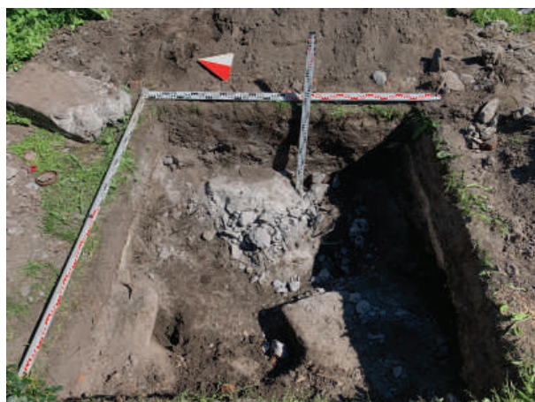
Рис. 15. Шурф 5. Фиксация по завалу железобетонных плит. Вид с запада