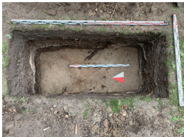
Рис. 24. Шурф 11. План фиксации по материку

Таким образом, в результате проведенных работ выявлен участок сохранившегося культурного слоя