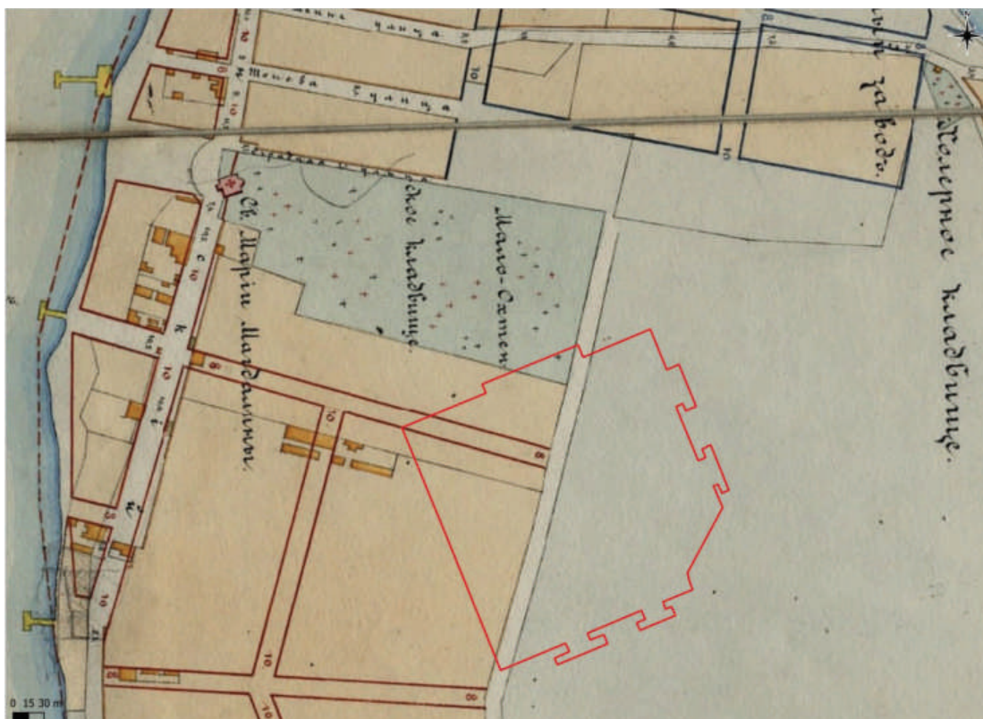
Рис. 3. Границы участка обследования на карте Петербурга 1861 г.