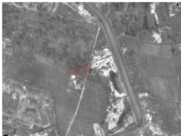
Рис. 10. Граница выявленного объекта на немецкой аэрофотосъемке Ленинграда 1942–1943 гг.

Кладбище располагалось по линии, тяготеющей к оси запад-северо-запад – восток-юго-восток от Малоохтинского пр. до Мариинской дороги. В границах обследуемого квартала предполагалось выявить его юго-восточный угол, утраченный при прокладке Перевозного пер. (рис. 5; 6). Восточная граница кладбища прилежала к несохранившейся Мариинской дороге, проходившей по оси юго-юго-запад – северо-северо-восток через обследуемую территорию. Границы кладбища и указанной дороги хорошо читаются на немецкой аэрофотосъемке 1942 г. (рис. 10), и при ее привязке к современной топооснове был определен подтреугольный участок, перспективный к обнаружению остатков захоронений, локализованный в северной части обследуемого квартала на незастроенной территории между жилыми домами по Перевозному пер. (Новочеркасский пр., д. 37, корп. 1; Перевозной пер., д. 9) (рис. 6). На немецкой аэрофотосъемке к южной границе кладбища, в месте примыкания к Мариинской дороге, также читается участок, принадлежавший в конце XIX в. и до революции садоводу А. С. Ефимовой. На участке, согласно архивным данным, располагался жилой дом, здания теплиц и оранжерея (ЦГИА СПб. Ф. 513. Оп. 101. Д. 251. Л. 3–5).