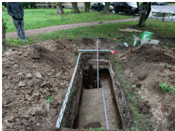
Рис. 18. Шурф 9. Фиксация по материке с выборкой столбовых ям 4 и 5. Вид с севера