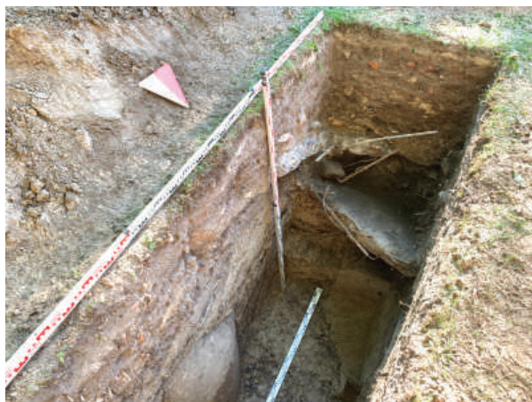
Рис. 20. Шурф 6. Фиксация по материке и впущенному в материк позднему перекопу. Вид с востока-северо-востока

Шурф 10 (рис. 22; 23), заложен в 6 м к востоку от юго-западного угла детской площадки. Координаты шурфа N59.930098793 E30.407804797 WGS 84; размеры 1 × 4,5 м, ориентация по сторонам света. В шурфе под малоомощной поздней подсыпкой на отметках