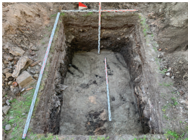
Рис. 19. Шурф 4. Фиксация по материке. Вид с востока