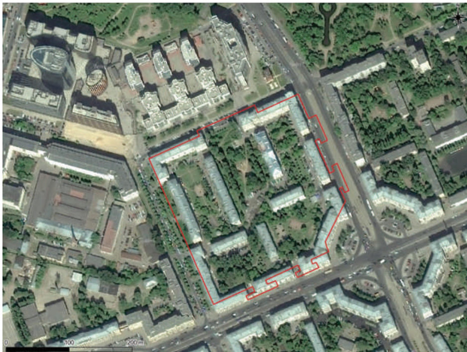
Рис. 2. Границы участка обследования на спутниковом снимке