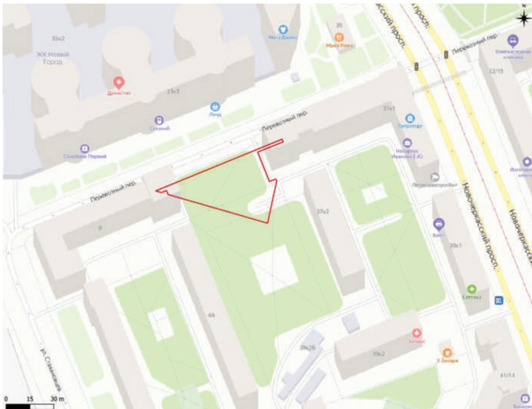
Рис. 6. Граница выявленного объекта на актуальной бланковой карте