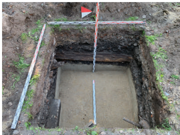
Рис. 14. Шурф 3. Фиксация по матерiku. Вид с востока

В связи с предположением о маркировании рядом столбовых ям границы кладбища, а также в виду выявленной в шурфах 1 и 2 высокой плотности погребений, перпендикулярно шурфу 7 был заложен шурф 9 (рис. 18), в котором были выявлены аналогичные столбовые ямы и не было обнаружено