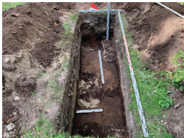
Рис. 16. Шурф 7. Фиксация по уровню выявления погребения 10 и столбовых ям 1–3. Вид с востока