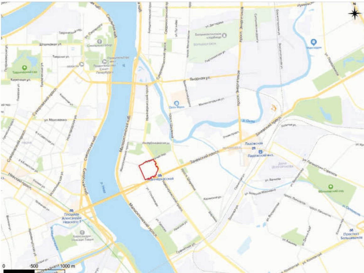
Рис. 1. Границы участка обследования на актуальной бланковой карте Красногвардейского района Санкт-Петербурга