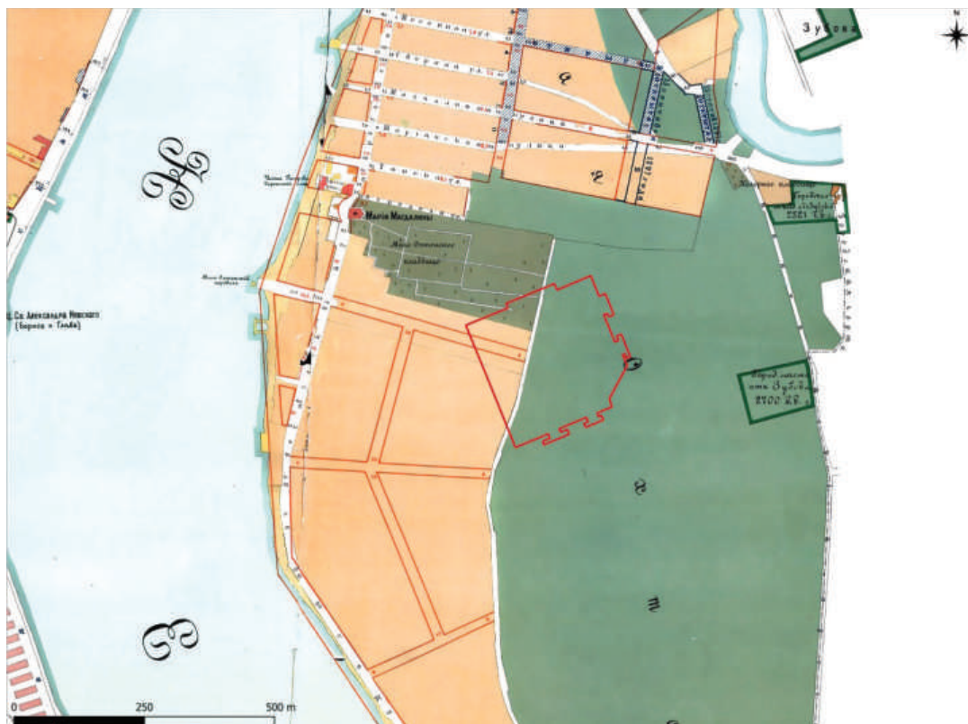
Рис. 4. Границы участка обследования на карте Петербурга 1908 г.