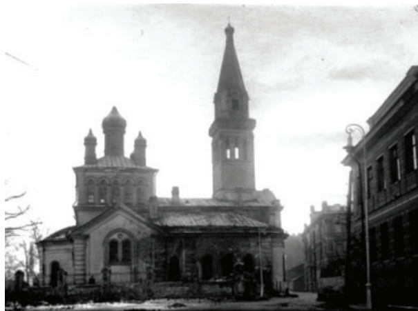
Рис. 7. Вид с севера на храм Марии Магдалины и кладбище (фотография 1925 г.)