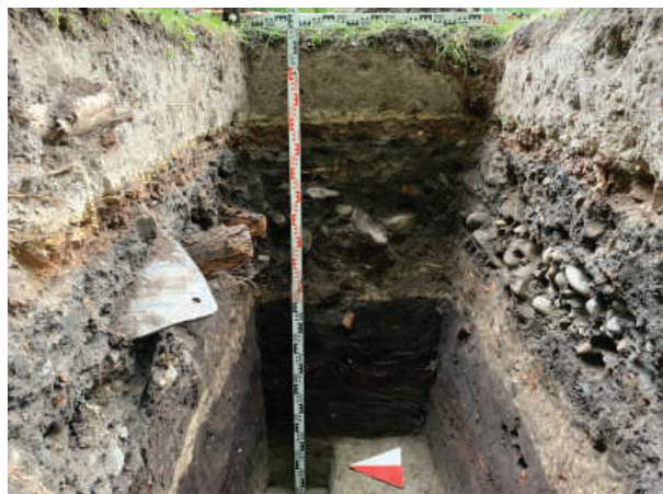
Рис. 23. Шурф 10. Фиксация по материку. Стратиграфия напластований Мариинской дороги. Вид с запада

4,57–5,60 м БС выявлена пачка слоев желтой супеси с кирпичным боем, серой супеси с кирпичным боем и строительным мусором, окатанных камней мелкого и среднего размера. Данные напластования отражают этапы устройства Мариинской дороги, маркирующей восточную границу выявляемой части Малоохтинского кладбища.