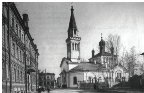
Рис. 8. Вид с юго-юго-запада на храм Марии Магдалины и ограду кладбища (фотография начала XX в.)

осмотр кладбища специальной комиссией, официально признавшей его переполненным. В постановлении также указывалось, что проект планировки района предусматривает продолжение через территорию кладбища Среднего проспекта Малой Охты (существовал с 1910 г., после 1956 г. вошел в застройку Новочеркасского пр. от ул. Помяловского до Республиканской ул.) (Краснолуцкий, 2011. С. 188). После публикации постановления в газетах, обеспокоенные жители Малой Охты направили в Исполнительный комитет Ленинградского городского совета письмо, где запущенность кладбища объяснялась бездействием надзорных органов. Забор кладбища был расхищен на дрова, могилы портились во время выгона домашнего скота, а также вследствие хулиганства пьяной молодежи. Заявление было передано в Городской отдел коммунального хозяйства, в чьем ведении находились городские кладбища, где, в свою очередь,