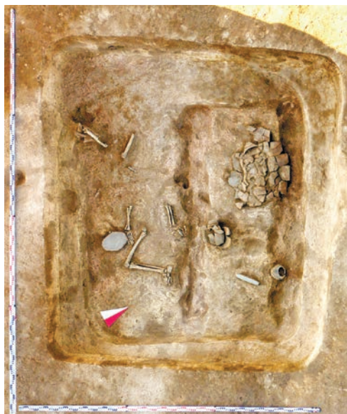
Рис. 2. Казановка-9, курган №1. Фото могилы сверху, с юго-востока Fig. 2. Kazanovka-9, kurgan 1. View to the grave from above, from the southeast