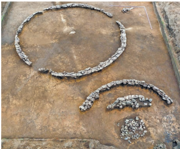
Рис. 1. Казановка-9. Вид на расчищенные каменные конструкции курганов 1 и 2 с северо-востока Fig. 1. Kazanovka-9. View from the northeast to the cleared stone structures of mounds 1 and 2