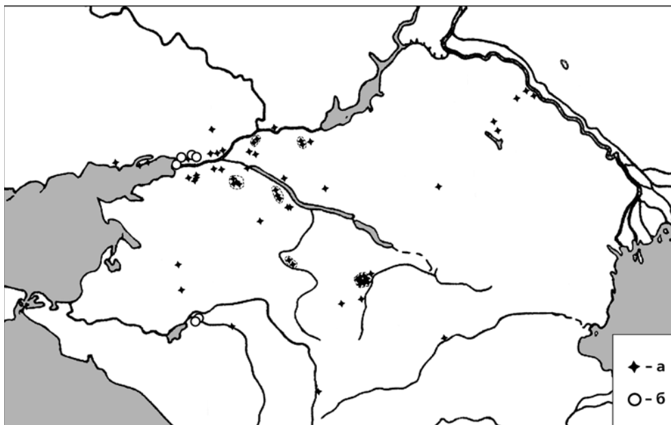
Рис. 1. Памятники отрадненской (а) и кобяковской (б) культур.