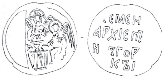
Рис. 5. Печать «Семена, архиепископа новгородского» (тип V/2/7)