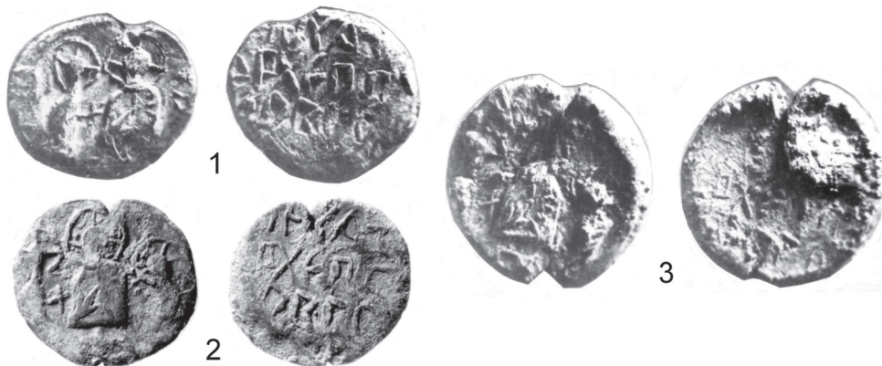
Рис. 2. Печати «архиепископа новгородского» (1-2 — тип V/2/2; 3 — тип V/2/3)