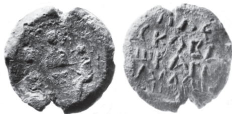
Рис. 1. Печать «плесковъшкаго намешника» (тип V/2/1)