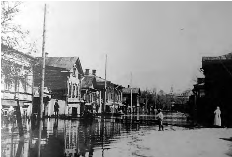
Рис. 3. Казань. Засыпкинская (Федосеевская) улица в начале XX в.