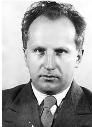
Рис. 17. М. К. Каргер в конце 1930-х гг.