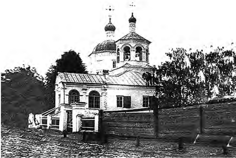
Рис. 2. Казань. Церковь св. прмц. Евдокии на Засыпкинской улице, где был крещен Михаил Каргер