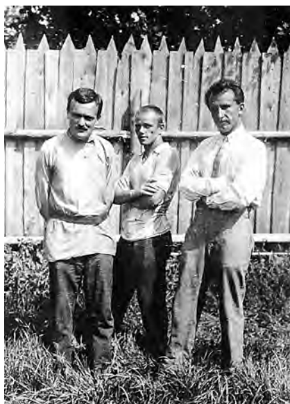
Рис. 13. А. В. Арциховский и М. К. Каргер в Новгороде в 1934 г.