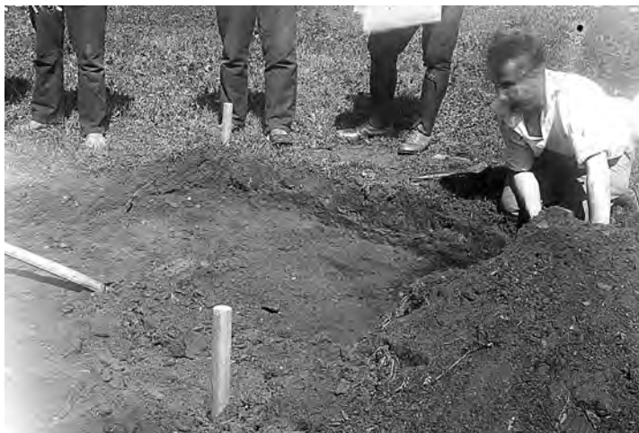
Рис. 14. М. К. Каргер на раскопе на Славенском холме, экспедиция ГАИМК в Новгороде в 1934 г.