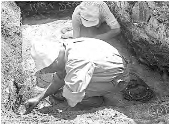
Рис. 20. М. К. Каргер расчищает захоронение в погребальной камере в центральном нефе Десятинной церкви. Киев. 1939 г.