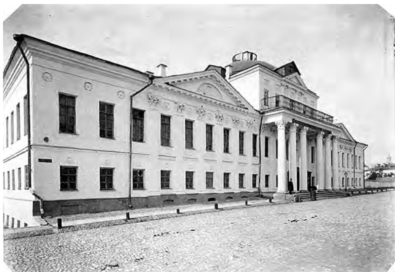
Рис. 4. Казань. Здание 1-й мужской гимназии, где обучался К. И. Каргер.