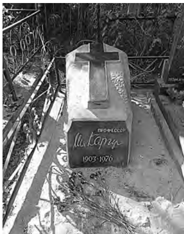
Рис. 41. Санкт-Петербург. Могила М. К. Каргера на Казанском кладбище в г. Пушкине