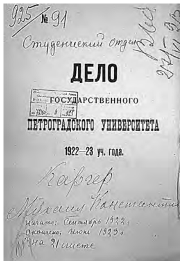
Рис. 10. Студенческое дело М. К. Каргера в Петроградском университете 1922–1923 гг. (ЦГА СПб. Ф. 7240. Оп. 6. Д. 925)