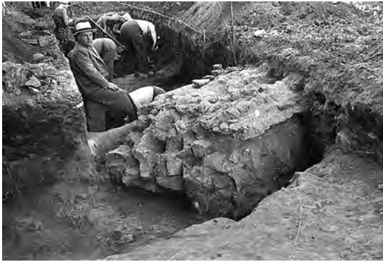
Рис. 32. М. К. Каргер на раскопках стены Митрополичьего двора в Киеве. Раскопки 1950 г. (ФО НА ИИМК РАН. К-997-44)