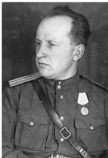
Рис. 26. М. К. Каргер в форме с погонами майора и медалью «За оборону Ленинграда», после февраля 1944 г. (ФО НА ИИМК РАН. II-80548)