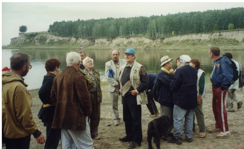
На полевой экскурсии на Красноярском водохранилище в 2000 г.