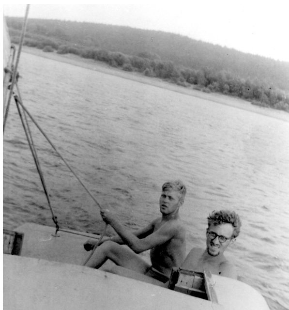
Студенческие годы. Маршрут по Каме в 1954 г.