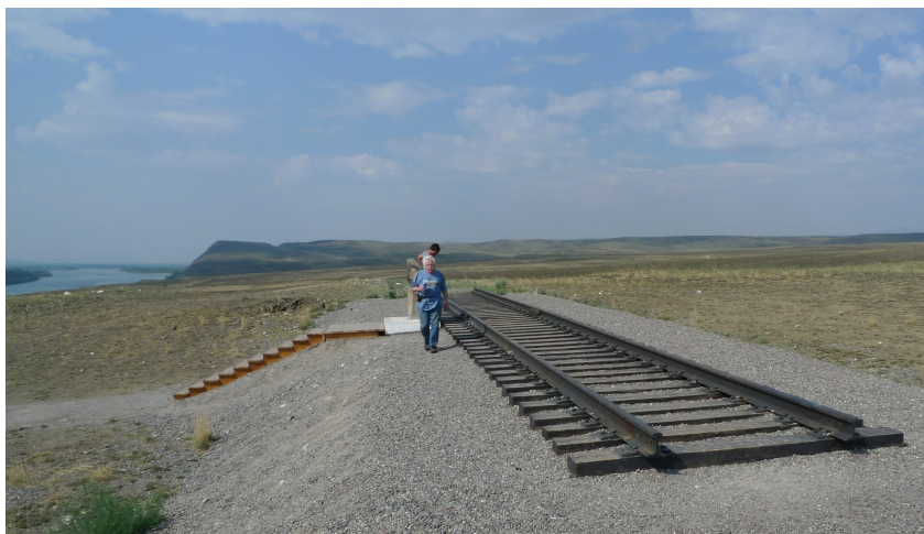
Железная дорога Курагино-Кызыл. В начале славных дел.