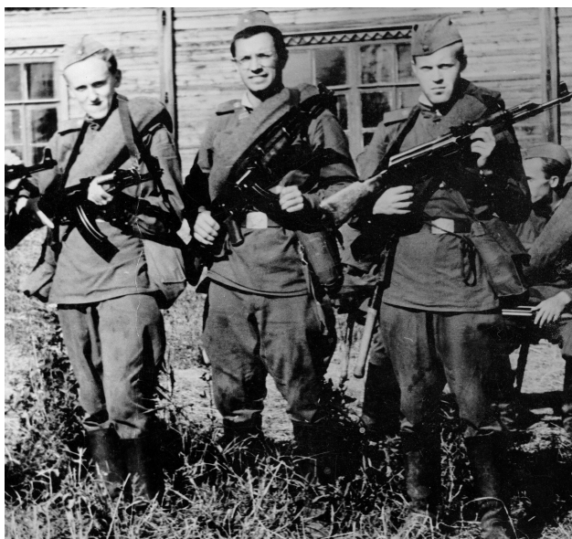
На военных сборах