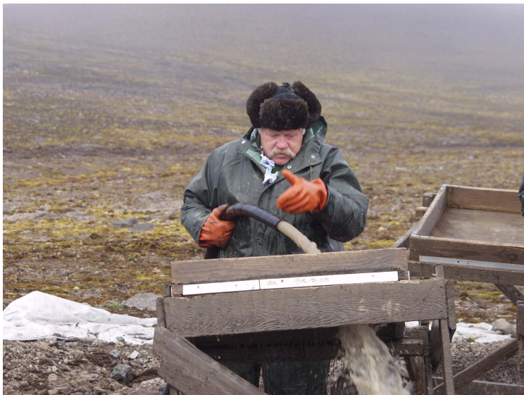
На острове Жохова, 2002 г.