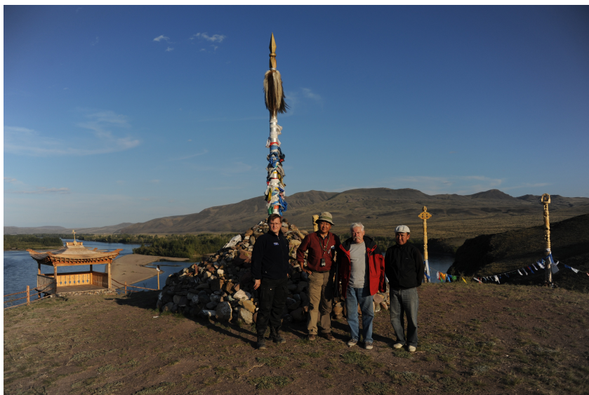
Снова в Туве. 2012 г.