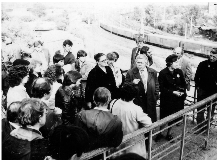
На полевой экскурсии конференции, посвященной столетию открытия Афонтовой Горы. Красноярск, 1984 г.