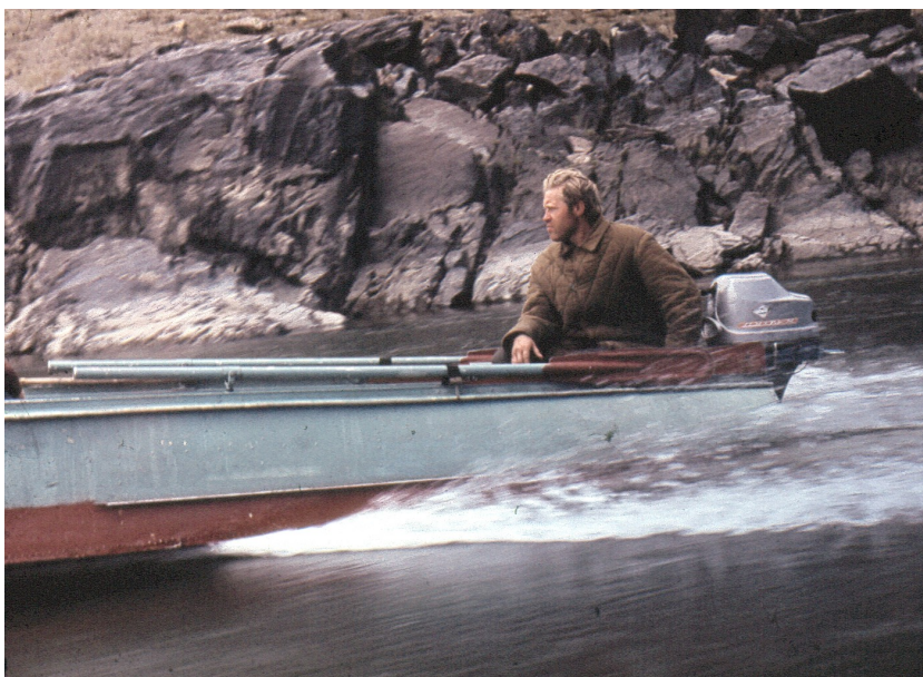
Преодолеваю пороги на «казанке»