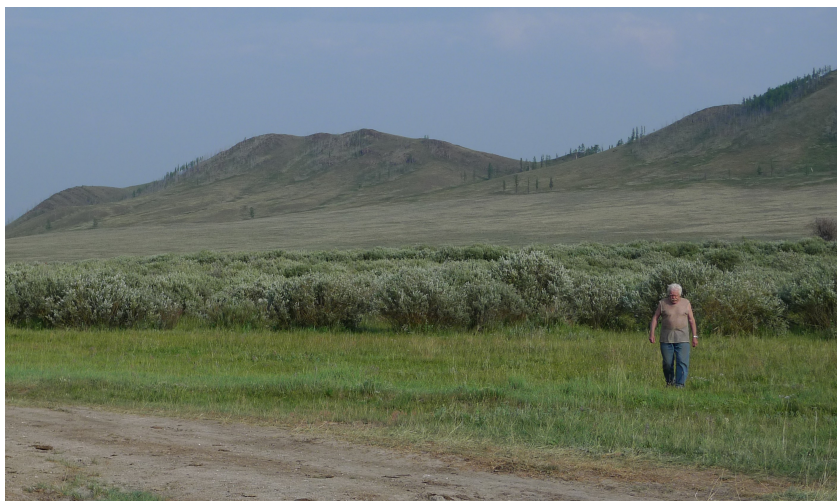
В поисках палеолита