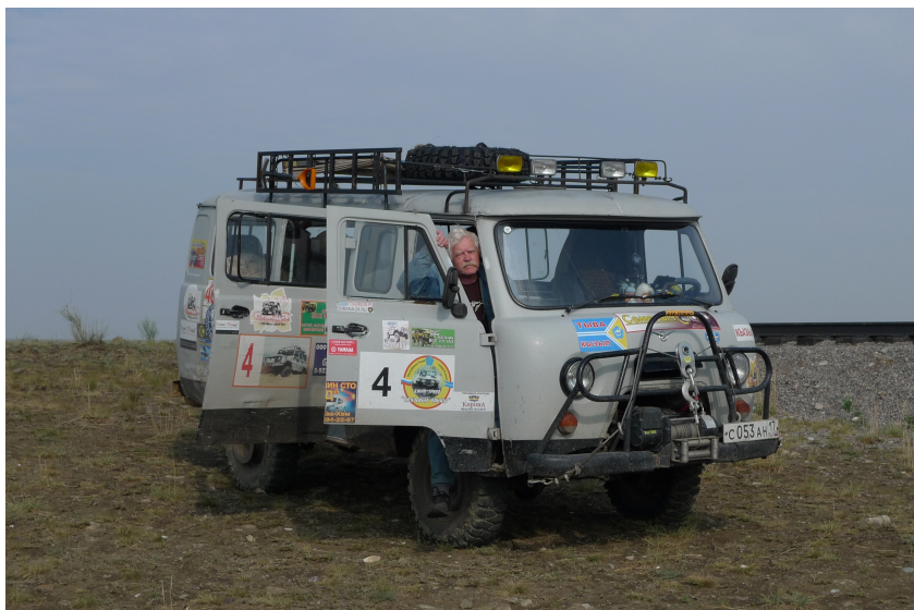
По дорогам Центральной Азии