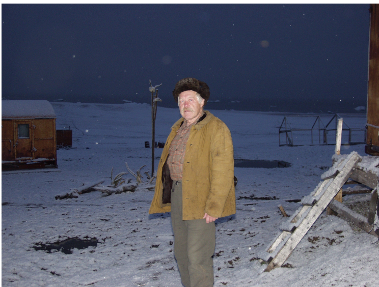
На острове Жохова, 2002 г. Август, перед отъездом