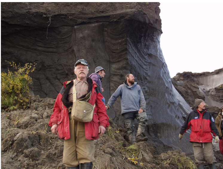
Поиски палеолита на Яне