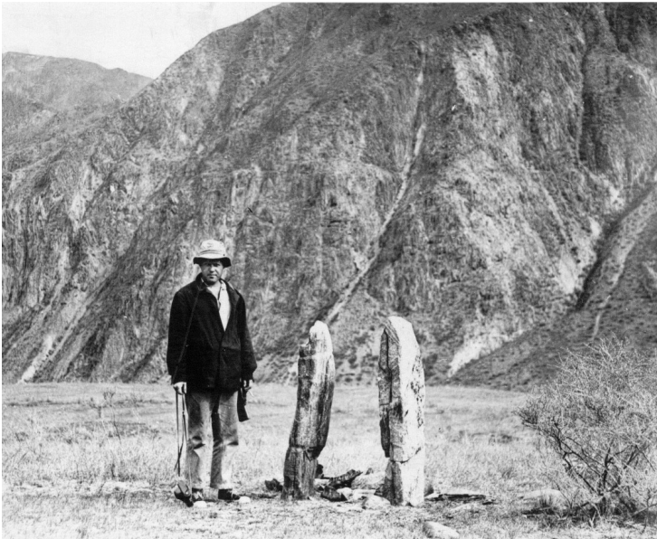
Начало работ в Туве