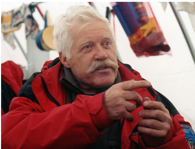
Оживленный спор после раскопок