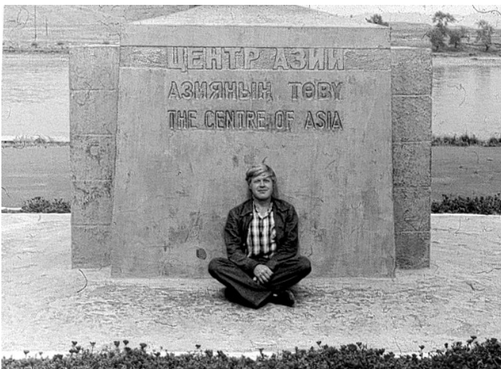
У Центра Азии (Кызыл)