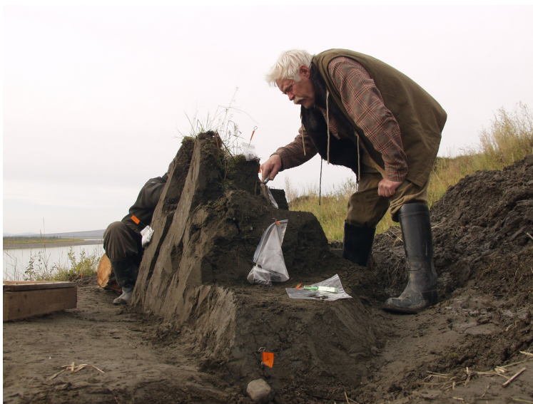
Янская стоянка. Расчистка останца