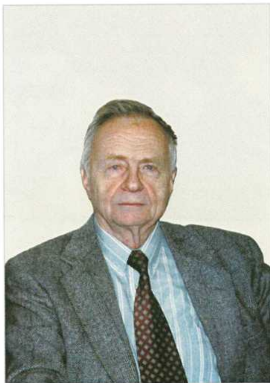
Фото 2004 г.