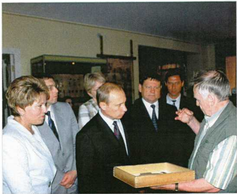
В музее археологии в Старой Ладоге 17 июля 2003 года