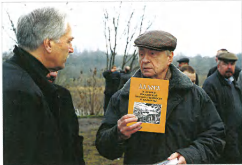
С Б. В. Грызловым в Старой Ладогe, 2003 г.