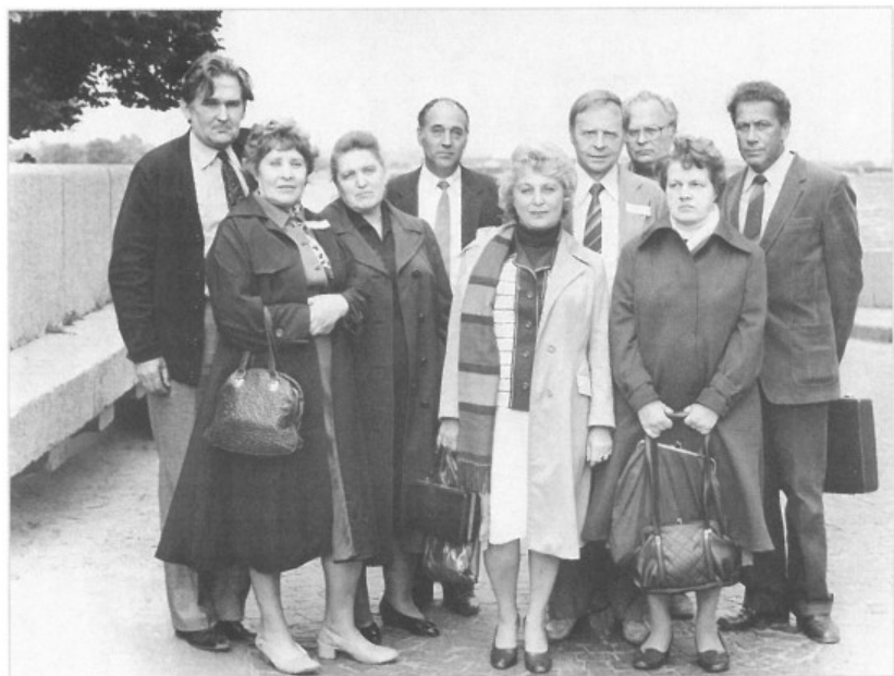
Выпускники кафедры археологии Ленинградского государственного университета на 30-летию выпуска в 1983 году