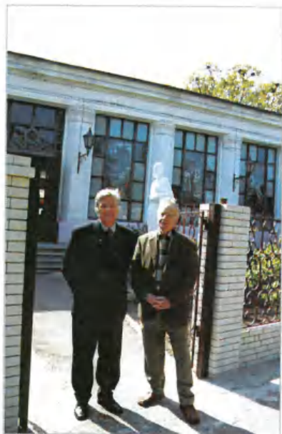
С П. П. Толочко в Переяславле-Хмельницком, 2004 г.