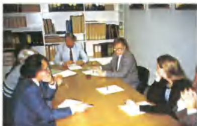
На заседании рабочей группы по финляндско-советскому научному сотрудничеству в области археологии. Хельсинки, 1991 г.