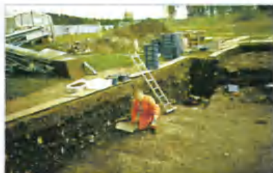
На раскопках в Бирке, 1991 г.