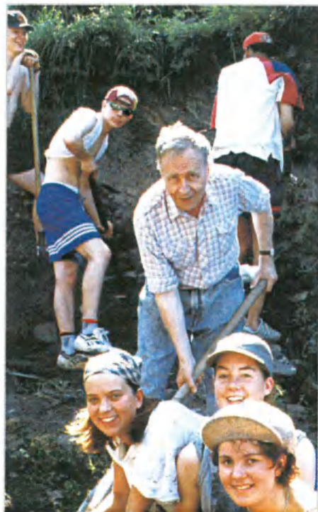
На раскопках «Земляного городища» в Старой Ладогe, 1999 г.