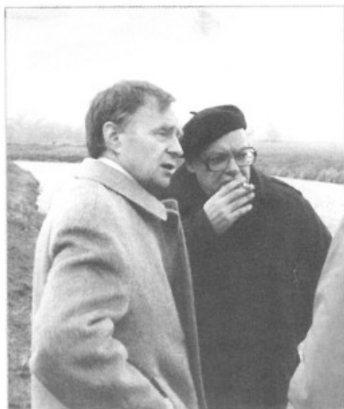
С В. Л. Яниным (1986 г.)