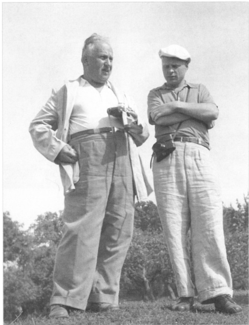
С профессором М. К. Каргером (1963 г.)