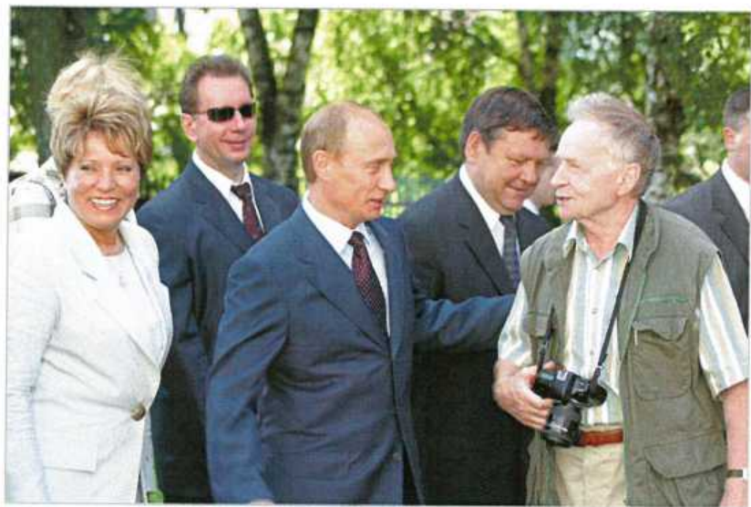
Старая Ладога. 17 июля 2003 г.