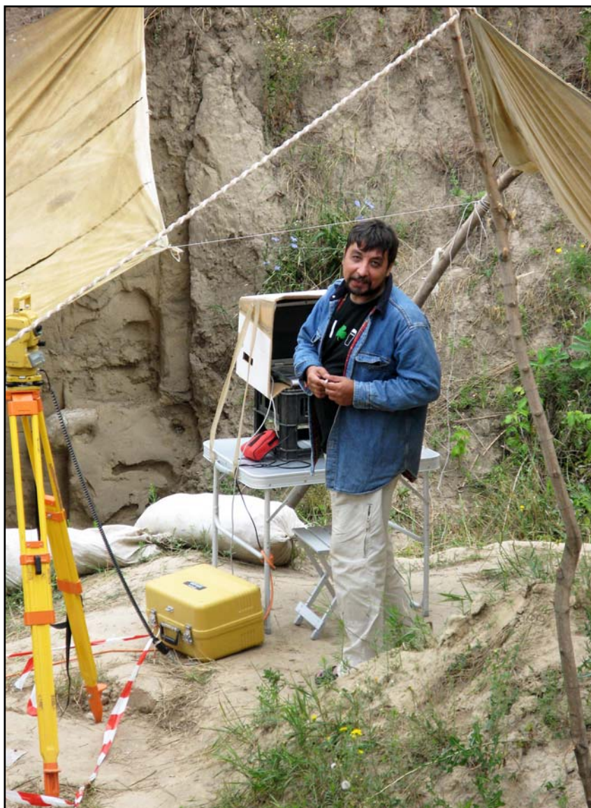
Фото 8. На раскопках стоянки Межирич. 26 июля 2007 г..

Photo 7. In Kostenki. Experimental expedition by the IHMC RAS. June 19 of 2007.