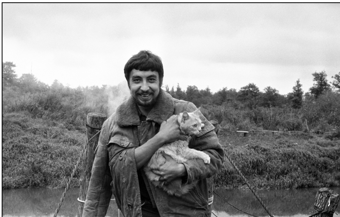
Фото 3. С котом Зефиром на навесном мосту через реку Дубну. 22 августа 1991 г..

Photo 3. With Zefir the cat on a suspension bridge over the Dubna river, August 22 of 1991.