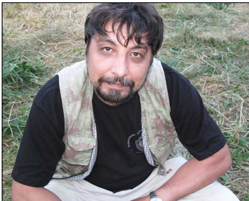
Фото 7. В экспериментальной экспедиции ИИМК РАН в Костенках. 19 июня 2007 г..

Photo 7. In Kostenki. Experimental expedition by the IHMC RAS. June 19 of 2007.