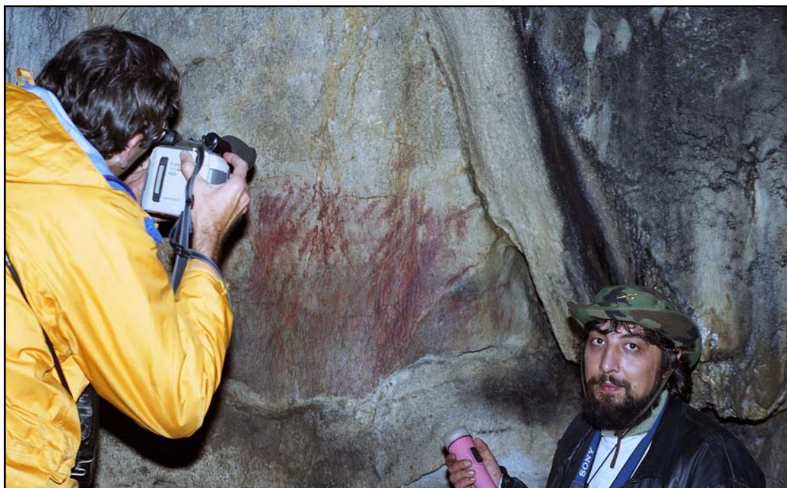
Фото 5. Рядом с рисунками на первом этаже Каповой пещеры во время конференции «Пещерный палеолит Урала». Слева — Билл Гасперини, корреспондент CBS в Москве. 12 сентября 1997 г..

Photo 5. V. Lozovski and Bill Gasperini (correspondent of CBS in Moscow) beside the drawings on the first floor of the Kapova cave during the conference "The Cave Paleolithic of the Urals", September 12 of 1997.