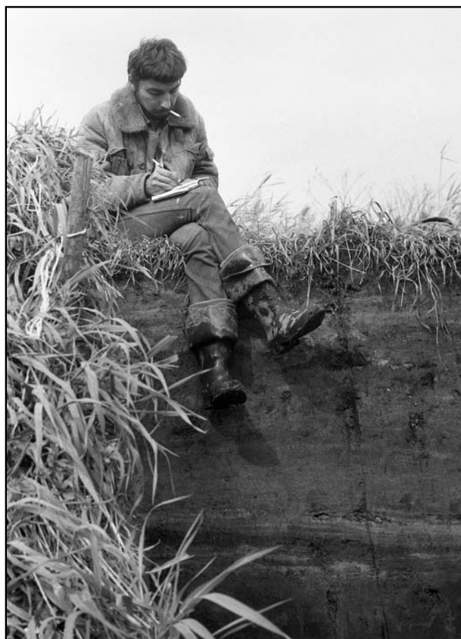
Фото 2. На раскопках стоянки Замостье 2, 19 августа 1991 г..

Photo 1. Southern Ural. View of the Kapova cave and expedition camp, July 12 of 1991.