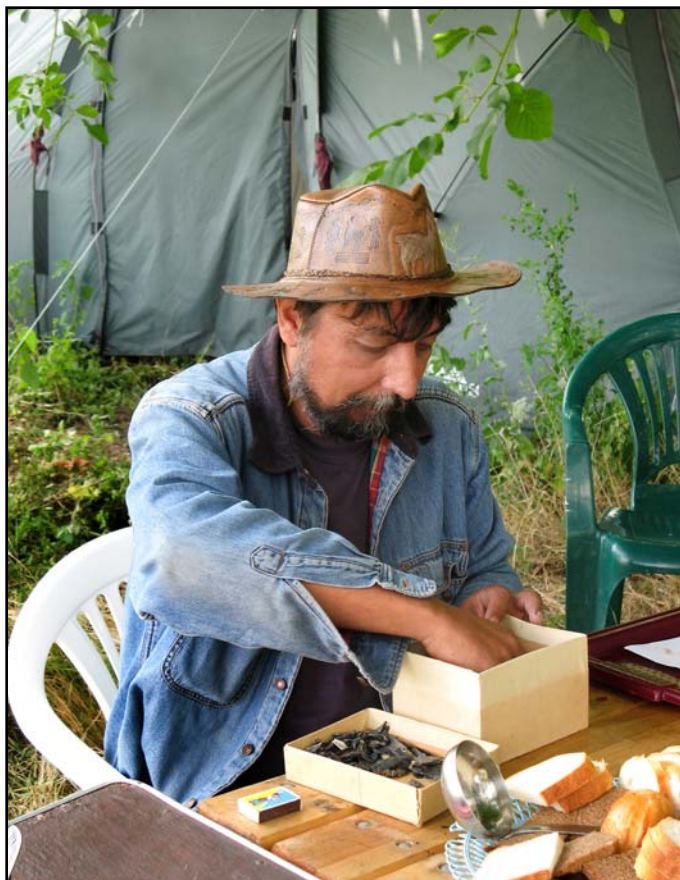
Фото 12. За изучением микропластин из 1 жилого комплекса стоянки Межирич на базе экспедиции. 9 августа 2009 г..

Photo 11. At the end of field season on the site of Mezhyrich, August 25 of 2008. Front row from left to right: D. Nuzhnyi, V. Lozovski, O. Lozovskaya, S. Pereverzev; standing behind are P. Shidlovsky and A. Evtushenko.