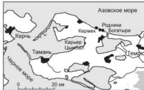
Рис. 1. Расположение раннепалеолитических стоянок на Таманском полуострове в Южном Приазовье

Активные поиски новых палеолитических стоянок в Южном Приазовье начались с 2002 г., когда на северном берегу Таманского полуост-