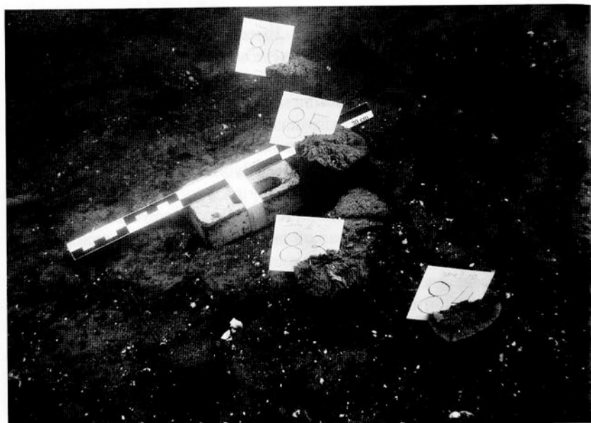
Рис. 1. Стоянка Замостье 2. Скопление кольев в русле р. Дубна

Эти хронологические отрезки могут маркировать определенную глубину водоема, благоприятную для экономической деятельности [Лозовская и др., 2013].