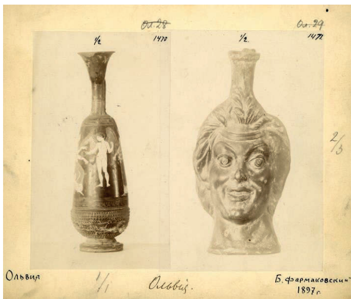
Рис. 1. Древности, приобретенные у Ш. Гохмана в 1897 г. Отп. Q 576/1.

К статье: Горская О. В., Медведева М. В. Покупка причерноморских древностей для Императорского Эрмитажа в конце XIX в. у братьев Гохманов