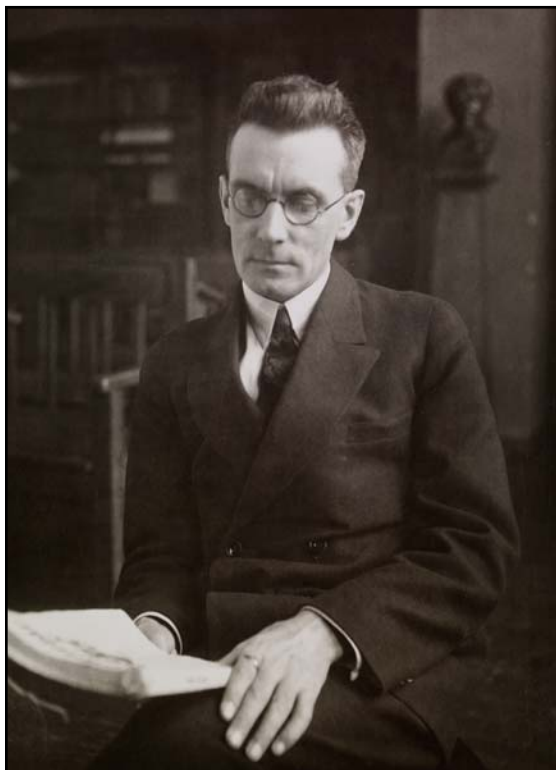
Рис. 2. Арне Михаэль Тальгрен. 1930-е годы.

Fig. 2. Arne Michael Tallgren. The 1930s.