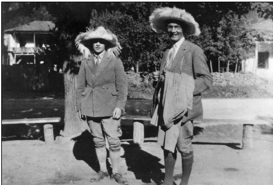
Рис. 4. А. М. Тальгрен и Н. Клеве в Пятигорске в 1928 году.

Fig. 4. A.M. Tallgren and N. Kleve in Pyatigorsk in 1928.