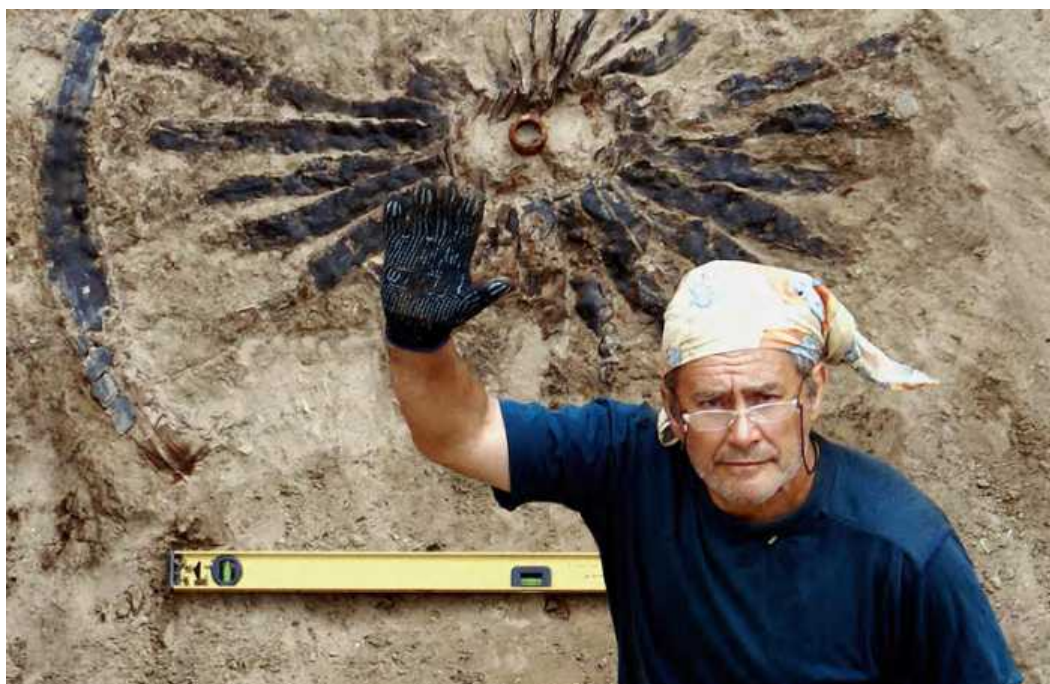
Сергей Степанович Миняев (1948–2020)