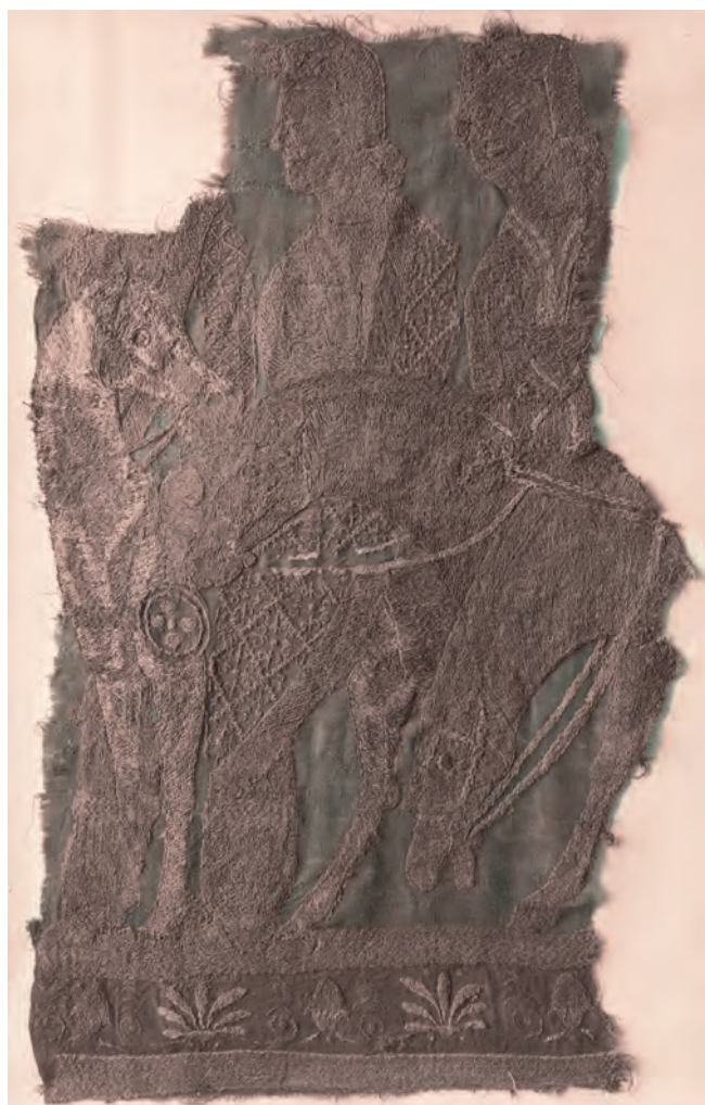
Fig. 4. Mongolia, Noin-Ula, Sutszukte creek valley, barrow 6, excavations of the Mongol-Tibet Expedition, 1924–1925, polychromic silk fragment. Autochrome, photo by I. N. Alexandrov, 1925. Photographic Division of the SA IHMC RAS, negative III 2857

Рис. 4. Монголия, Ноин-Ула, падь Суцзуктэ, кург. 6, раскопки Монголо-Тибетской экспедиции, 1924–1925 гг., фрагмент полихромного шелка. Автохром, фото И. Н. Александрова, 1925 г. НА ИИМК РАН. ФО. Нег. III 2857