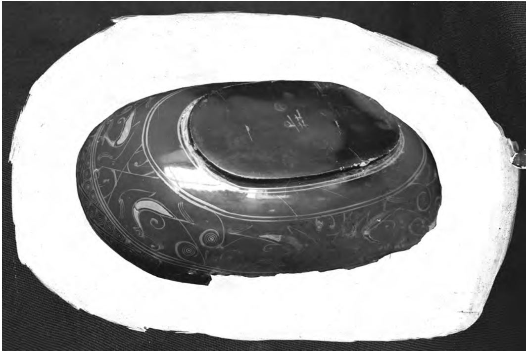
Рис. 5. Монголия, Ноин-Ула, падь Суцзуктэ, кург. 6. Раскопки Монголо-Тибетской экспедиции, 1924–1925 гг. Деревянная лакированная чашечка эр бэй . Изображение после ретуширования в процессе подготовки к полиграфическому воспроизведению. Фото И. Н. Александрова, 1925 г. НА ИИМК РАН. ФО. Нег. III 2873

Fig. 5. Mongolia, Noin-Ula, Sutszunkte creek valley, barrow 6, excavations of the Mongol-Tibet Expedition, 1924–1925, lacquered wooden cup er bai (image after retouching in the process of preparation for polygraphic reproduction). Photo by I. N. Alexandrov, 1925. Photographic Division of the SA IHMC RAS, negative III 2873