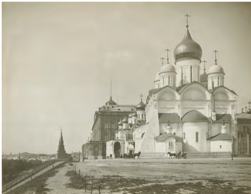
Рис. 1. Москва, Кремль, Архангельский собор. Фото И. Н. Александрова, 1890-е гг. НА ИИМК РАН. ФО. Отп. Q 331-38

Fig. 1. Moscow, Kremlin, Archangel Cathedral. Photo by I. N. Alexandrov, 1890s. Photographic Division of the SA IHMC RAS, print Q 331-38