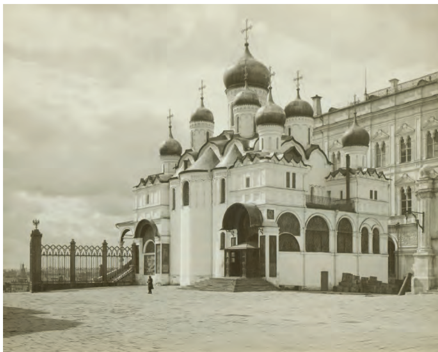
Рис. 2. Москва, Кремль, Благовещенский собор. Фото И. Н. Александрова, 1890-е гг. НА ИИМК РАН. ФО. Отп. Q 331-39

Fig. 1. Moscow, Kremlin, Archangel Cathedral. Photo by I. N. Alexandrov, 1890s. Photographic Division of the SA IHMC RAS, print Q 331-38