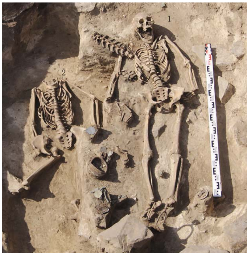
Рис. 7 (фото) Курган № 4, погребения 1 и 2