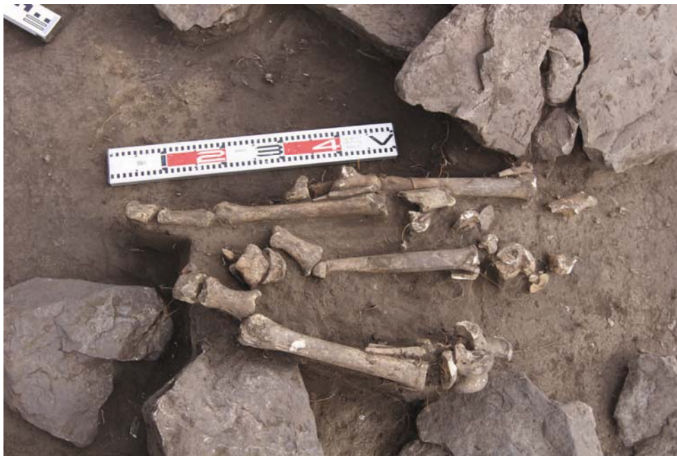
Рис. 6 (фото). Курган № 4, кости ног коня на уровне древней погребенной почвы

Погребение сопровождал типологически разнообразный сопроводительный инвентарь, изготовленный из железа и бронзы,