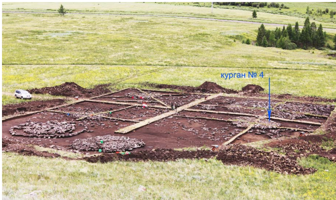
Рис. 1 (фото). Общий вид площади раскопа 1 могильника Саяны-Пограничное-4