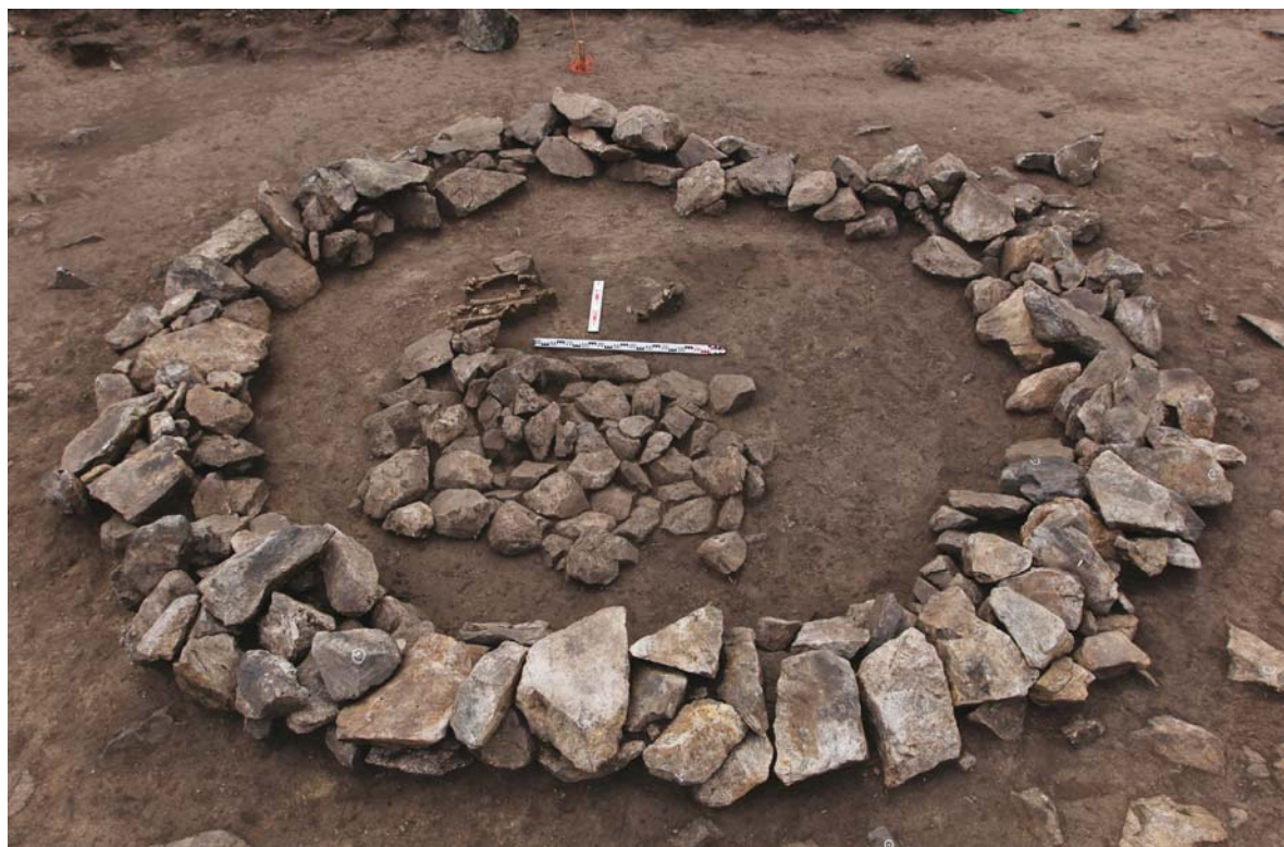
Рис. 4 (фото). Курган № 4, уровень горизонта II