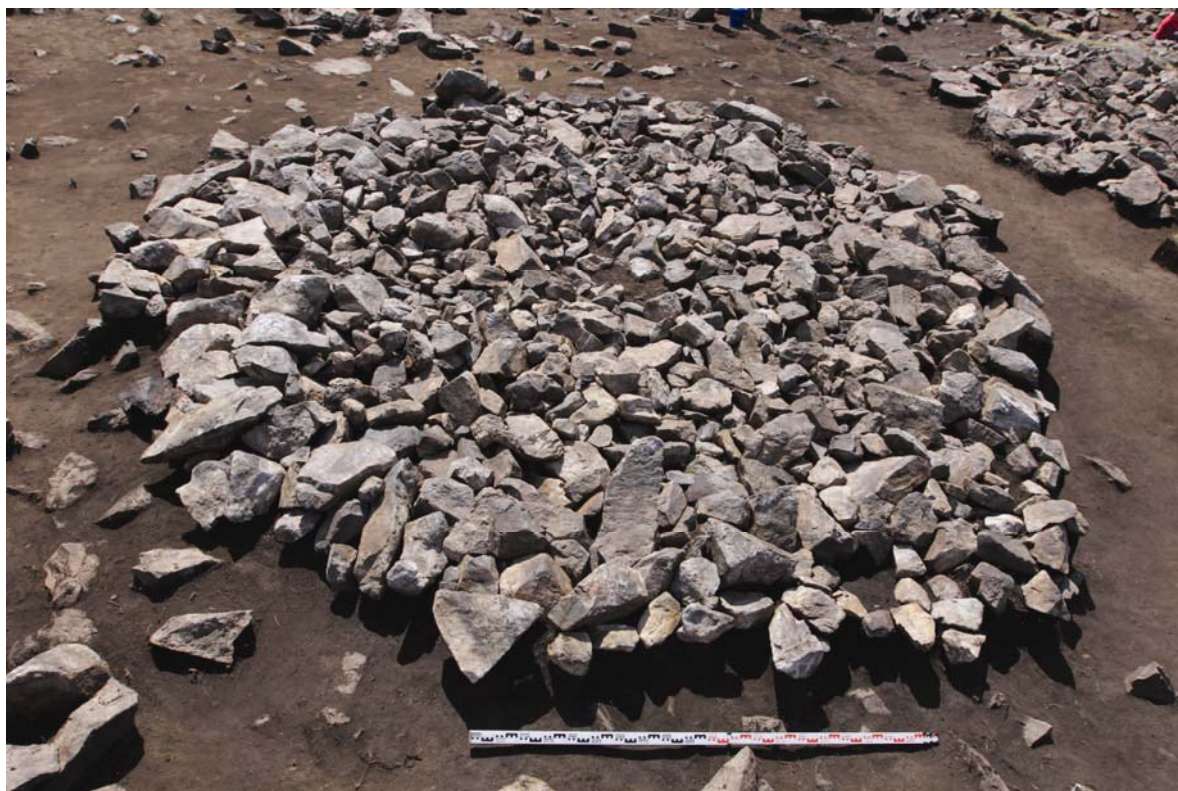
Рис. 2. (фото). Курган № 4, уровень горизонта 1

чавшиеся отрядами экспедиции, сосредоточены вдоль правого берега р. Иджим, являющейся левым притоком р. Ус. Краткий обзор охранных работ в 2012–2013 гг. нашел