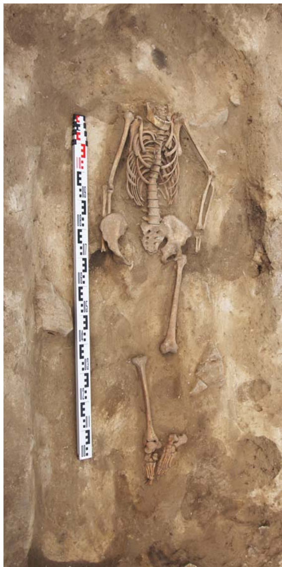
Рис. 8 (фото). Курган № 4, погребение 2

многие предметы со следами позолоты. Это остатки конской сбруи и украшения одежды человека. Объем данной статьи не позволяет всесторонне проанализировать находки, и в этой связи возникает необходимость рассмотреть предметный комплекс в отдельной публикации. В то же время, как отмечалось выше, целью данной статьи является этнокультурная характеристика погребения со шкурой коня на основе археологических, исторических и этнографических данных, однако этой процедуре должна предшествовать датировка памятника, дающая основание для его рассмотрения в историческом контексте. Поэтому, забегая вперед и надеясь, что отступление от методических правил не скажется на качестве исследования, отметим: сравнительно-типологический ана-