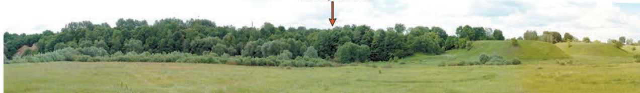
Разрез № 3 2012, 2018 гг.