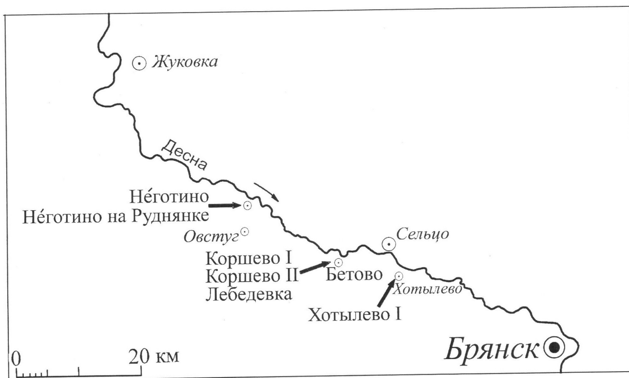
Рис. 1. Среднепалеолитические памятники Верхней Десны (по материалам отчетов Л.М. Тарасова)

ке, окатанный инвентарь которых характеризуется неразвитостью и архаичностью.